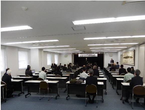
シンポジウム全景(1)