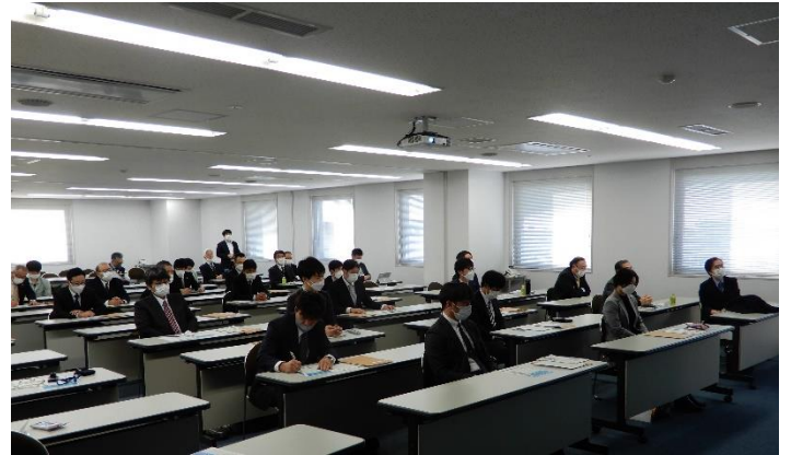
シンポジウム全景(2)