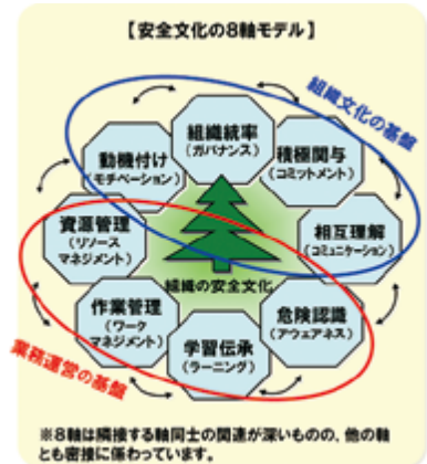
安全文化の8軸モデル