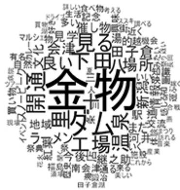
地域イメージの把握(一例:結果図は一部加工)