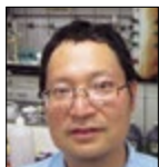
自然科学系 准教授