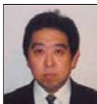
自然科学系 准教授