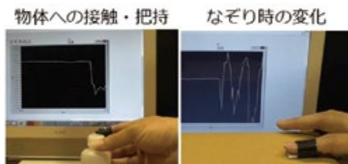
図2 指先に装着しての把持・なぞり検知