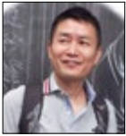
自然科学系 准教授