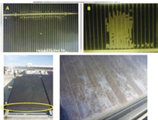
剥離型PIDを起こした太陽電池の外観