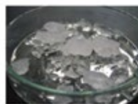
ガスハイドレート (水状の固体結晶)

またこれらの研究経験を生かして、ガスハイドレートスラリーだけでなく、様々な固液スラリーの流動性についても同じように流動性や粘性改善提案のための検討をしようとしています。