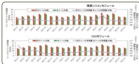
太陽電池モジュールの発電量の推移