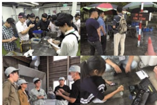
国際グループワークインターンシップの様子