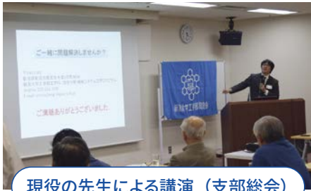
現役の先生による講演（支部総会）