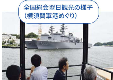
全国総会翌日観光の様子 (横須賀軍港めぐり)