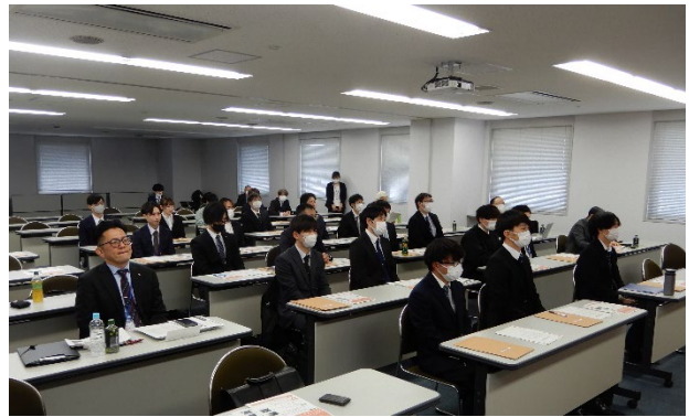
シンポジウム全景(2)