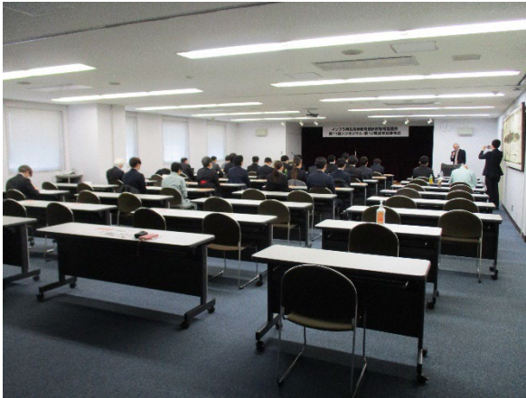
シンポジウム全景(1)