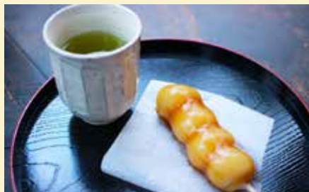
煎茶（あさつゆ）・醤油団子セット 300円