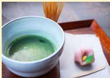
抹茶（越乃薫）・練り切りセット 600円

普段は非公開の松ノ間から眺めることのできる美しい庭の景色とともに、下町の人気店「フレンド」さんや「真保餅屋」さんの和菓子と、「小川園」さん協力のもと、学生が心を込めて淹れたお茶を飲んであたたかなひとときを過ごしませんか？ 今年は寝間において抹茶のお茶たても体験できます。また、抹茶の茶碗には、陶芸家の方に作陶して頂いた茶碗「北前船茶碗」を使用しています。