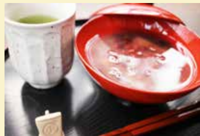
煎茶（あさつゆ）・おしるこセット 500円