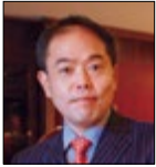
人文社会科学系 准教授