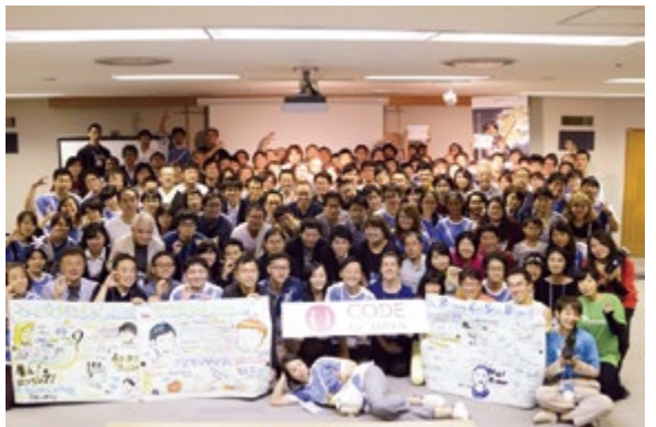
シビックテック団体(一社)Code-for-Japanサミットの様子(新潟市)